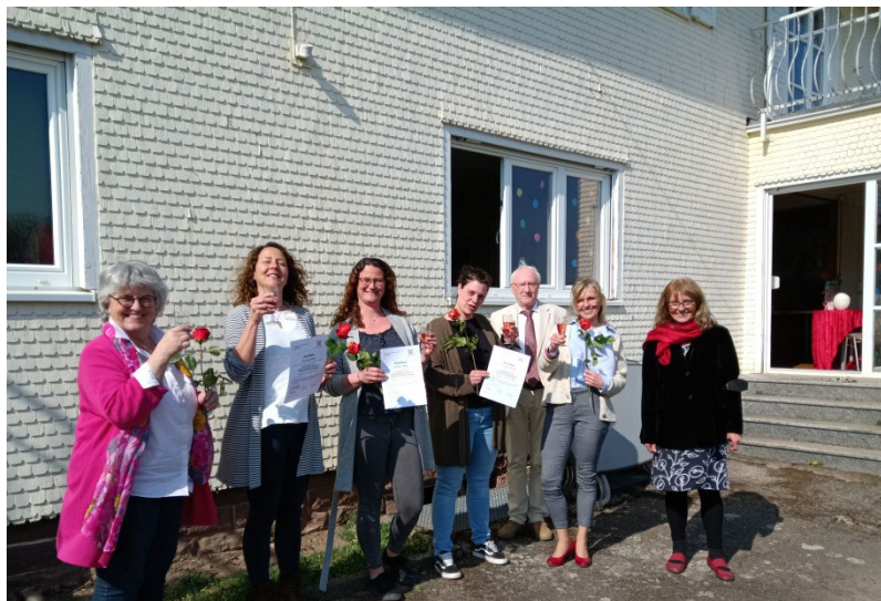
Qualifizierung zur Elternberater:in 2022