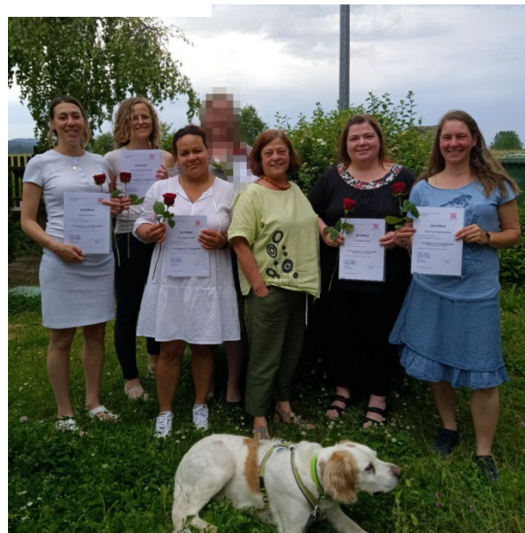
Qualifizierung Frühpädagogik 2022